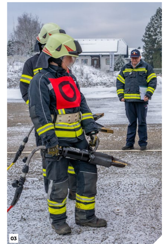
01 Die Aufstellung zur THL-Leistungsprüfung.